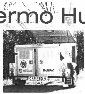
Sondermodell Thermo Campeón