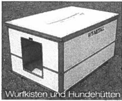
Wurfkisten und Hundehütten