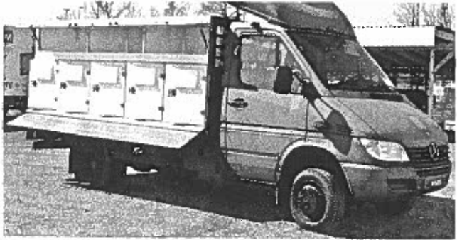
Thermo - Aufsatz auf Pick up oder Plattformanhänger