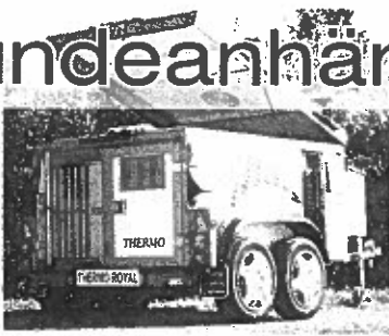
Luxusmodell Thermo Royal