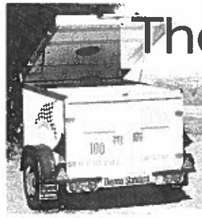
Basismodell Thermo Standard